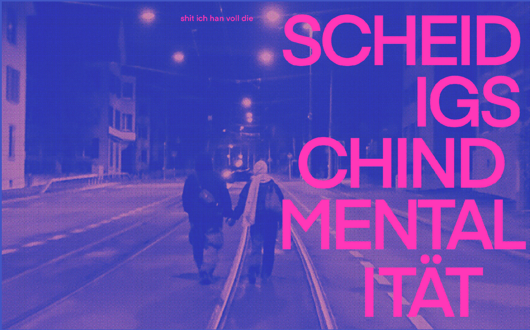
Zwei Zimmer und kein Glaube a wahri Liebi